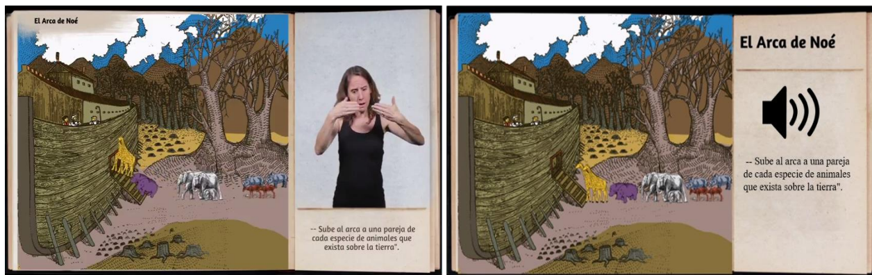
Figura 1. Interfaz de las distintas versiones de la Biblia Inclusiva: versión para sordos (izquierda) y versión para ciegos (derecha).

texto en LSCh. Además cuenta con subtítulos a la base de la imagen. Para los niños ciegos, en cambio, se presenta como un radioteatro en 36 breves episodios, en el cual varias voces leen de forma teatralizada el texto, al que se agregan en algunas ocasiones otros sonidos o ruidos presentes en el relato, como audio enriquecido (ver figura 1).